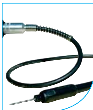
Flexible avec mandrin ø 3 mm pour micro outillage Flexible hose with chucks for micro tooling