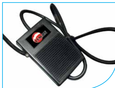
Commande de Marche/Arrêt par pédale Control On/off pedal